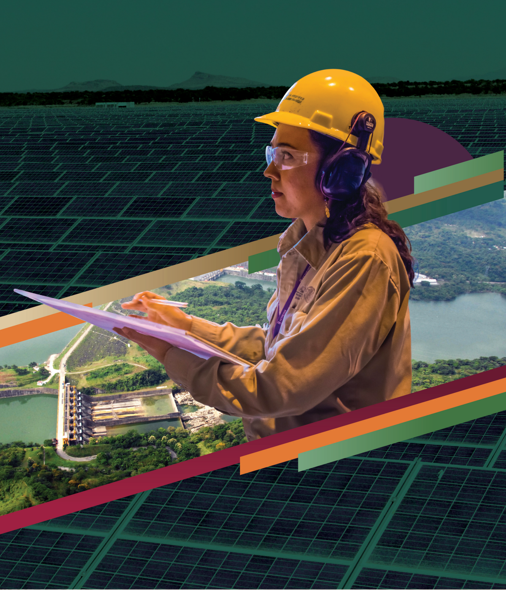
Central fotovoltaica, Viesca, Coahuila. Central hidroeléctrica, Ostuacán, Chiapas. Comisión Federal de Electricidad.