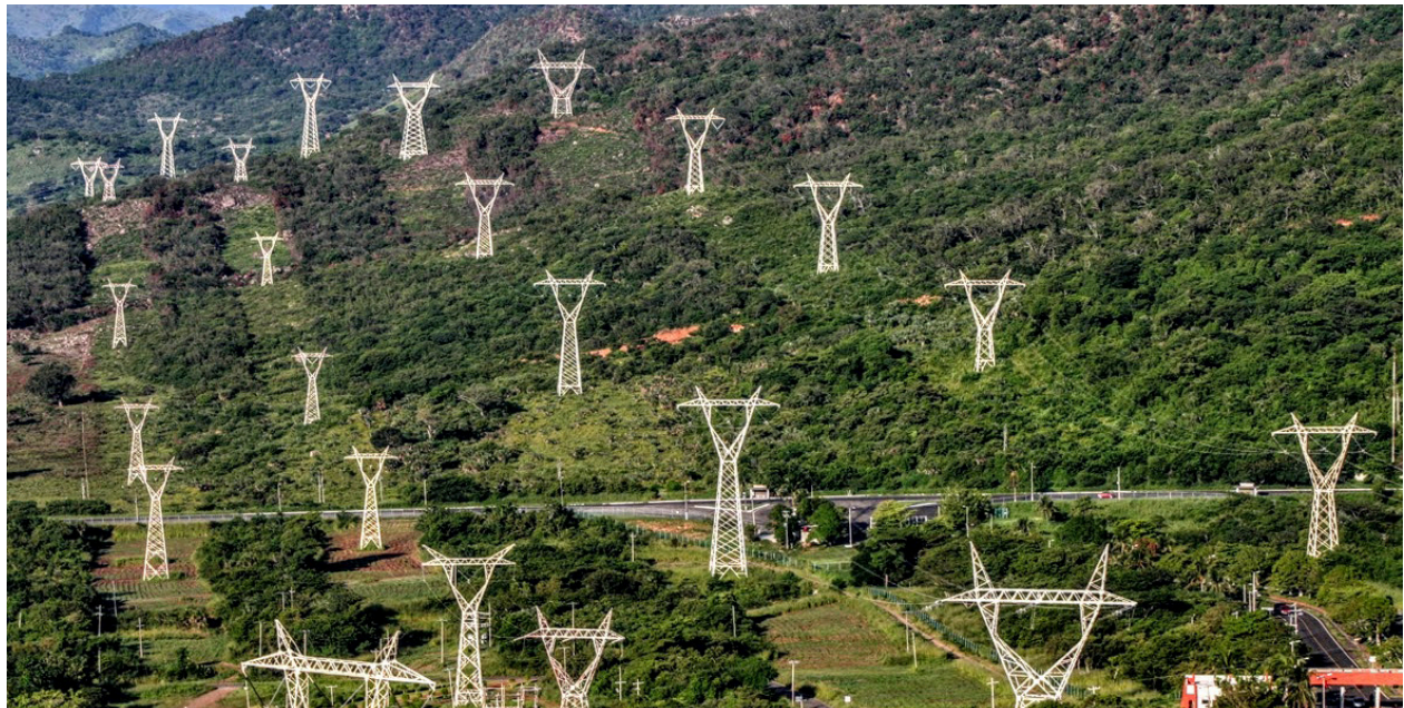
Líneas de transmisión, Alto Lucero de Gutiérrez Barrios, Veracruz. Comisión Federal de Electricidad.