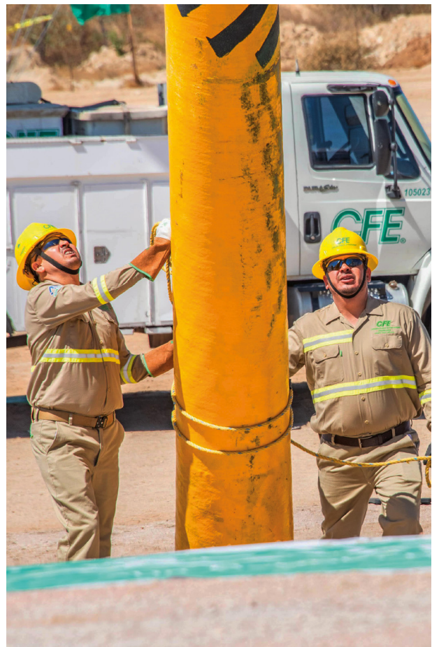
Reunión Nacional de Huracanes 2024 , Los Cabos, Baja California Sur. Comisión Federal de Electricidad

Los requerimientos de ampliación y modernización de la infraestructura eléctrica de las RGD se soportan en el diagnóstico de su condición actual, en términos de sus indicadores de eficiencia, Calidad y Confiabilidad, el pronóstico de demanda máxima en Subestaciones Eléctricas 2024-2038 de acuerdo con el CENACE y los criterios económicos establecidos por la SHCP y la SENER utilizados para la evaluación económica de los proyectos para la selección de las opciones de costo mínimo, ver cuadro 6.1.