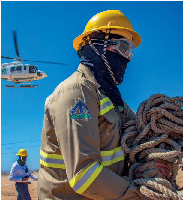
Reunión Nacional de Huracanes 2024, Los Cabos, Baja California Sur. Comisión Federal de Electricidad.